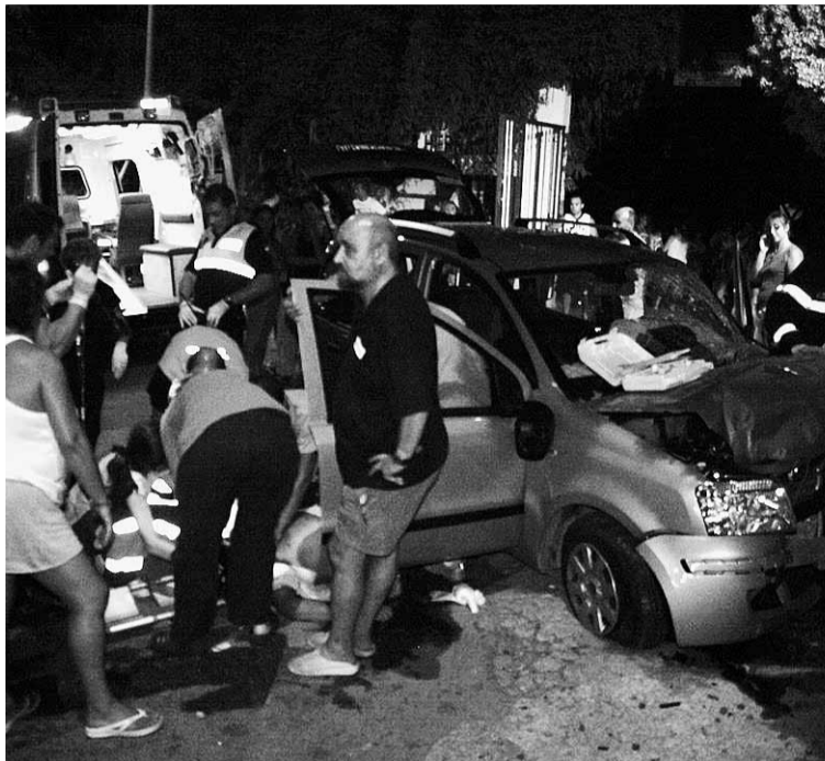
El cadáver del conductor, junto al vehículo que conducía.

«El accidentado se encontraba consciente y hablaba algunas palabras hasta el momento de la llegada de la ambulancia que entró en