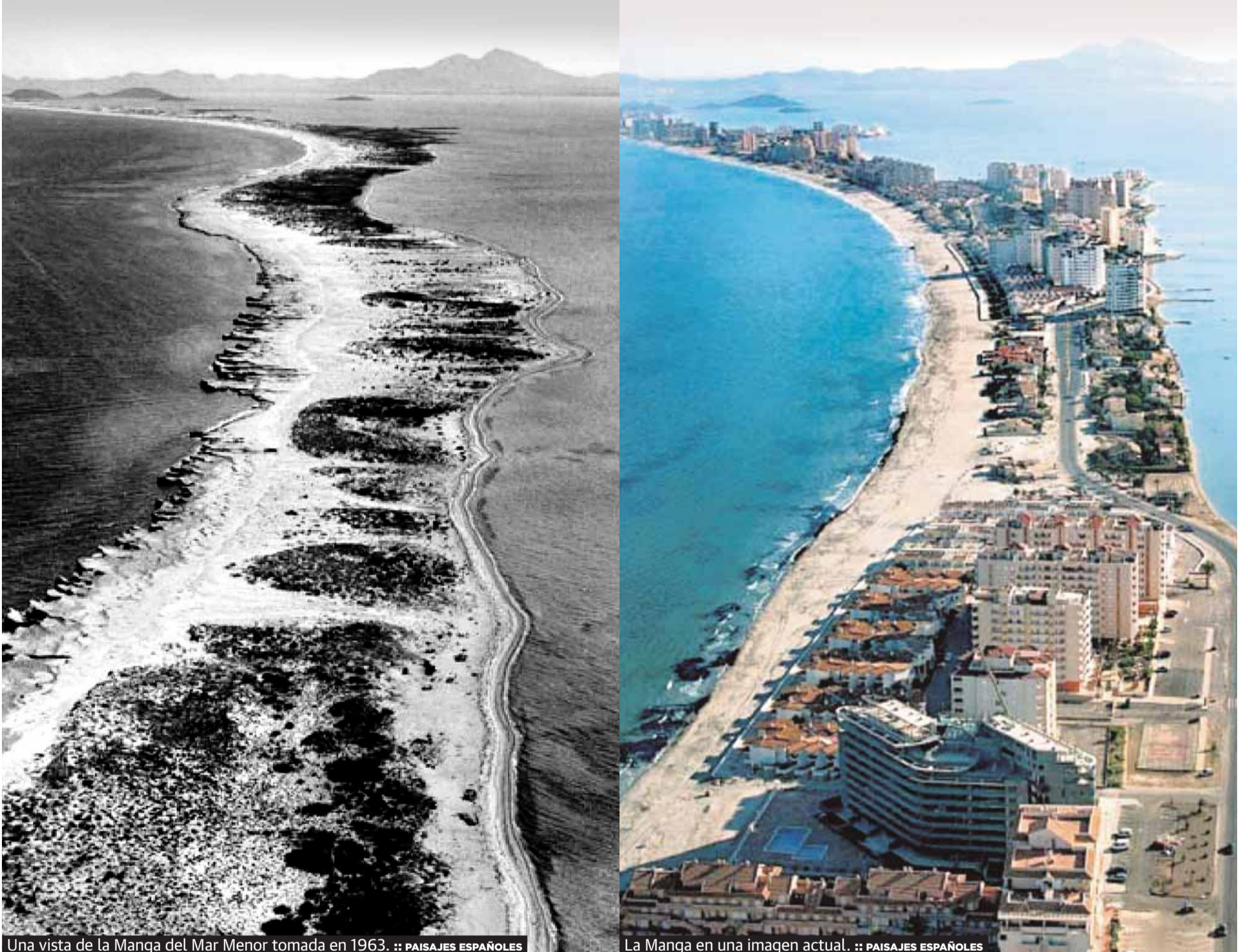
Una vista de la Manga del Mar Menor tomada en 1963. :: PAISAJES ESPAÑOLES

LOS PRÍNCIPES, LOS 'BRANGELINOS', 'PE' Y BARDEM... UN LOOK PARA CADA OCASIÓN P8