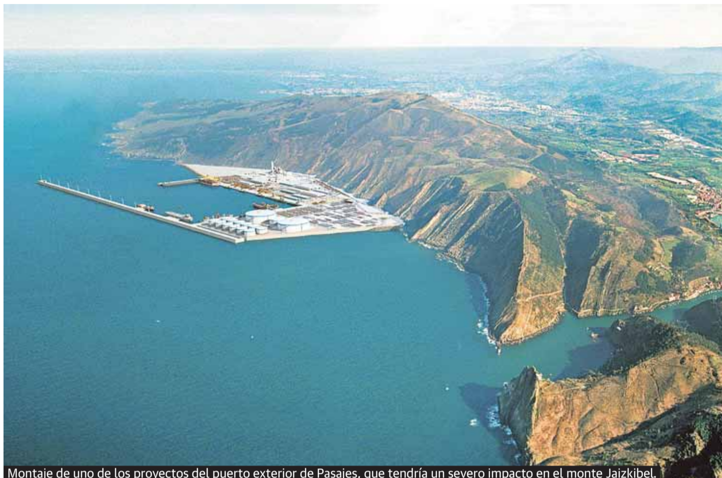
Montaje de uno de los proyectos del puerto exterior de Pasajes, que tendría un severo impacto en el monte Jaizkibel.