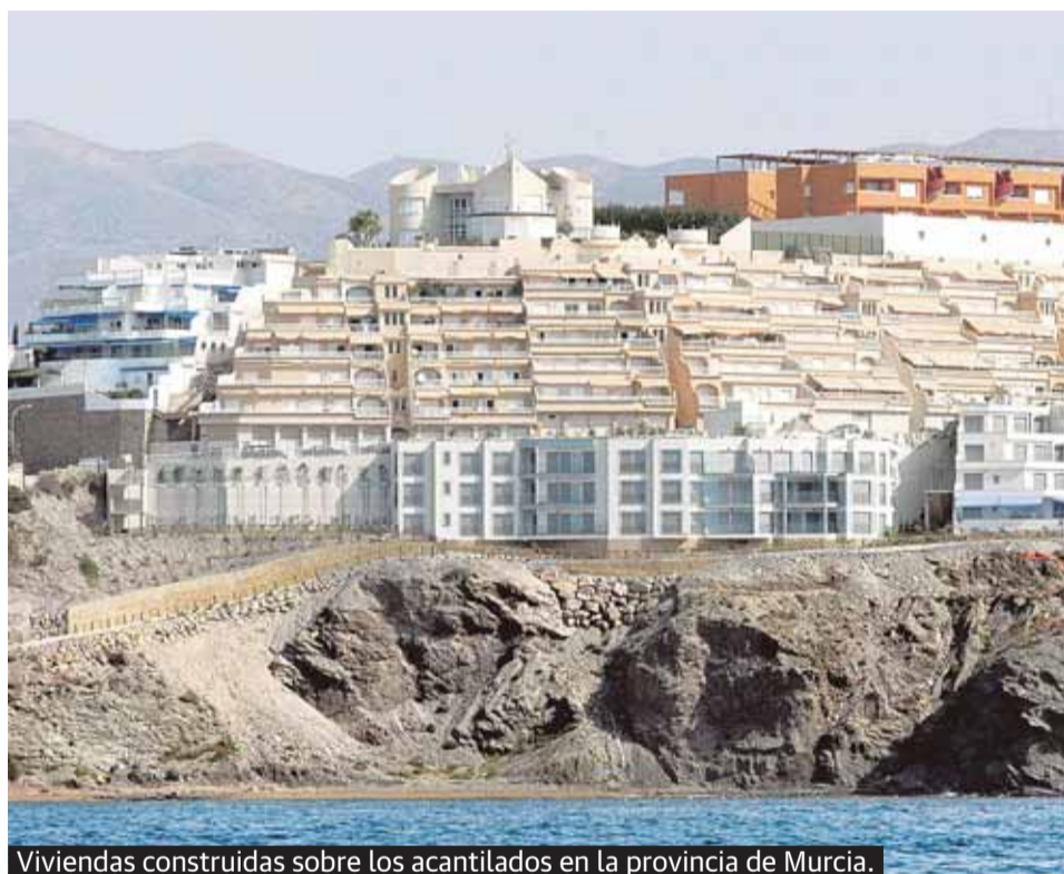
Viviendas construidas sobre los acantilados en la provincia de Murcia.