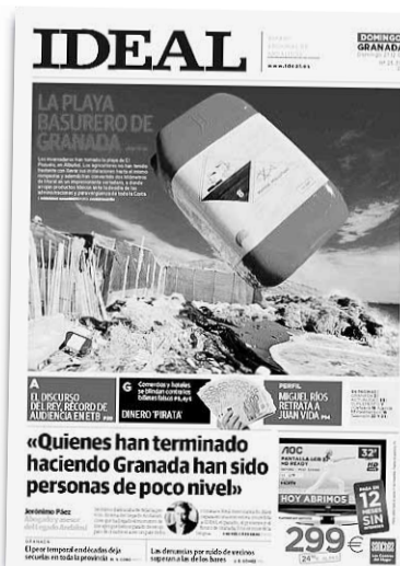
Portada de IDEAL del día 27 de diciembre de 2009.

2011: La playa de El Pozuelo sigue siendo un vertedero y la Fiscalía aún no ha resuelto nada sobre el tema porque aún no ha recabado toda la información.